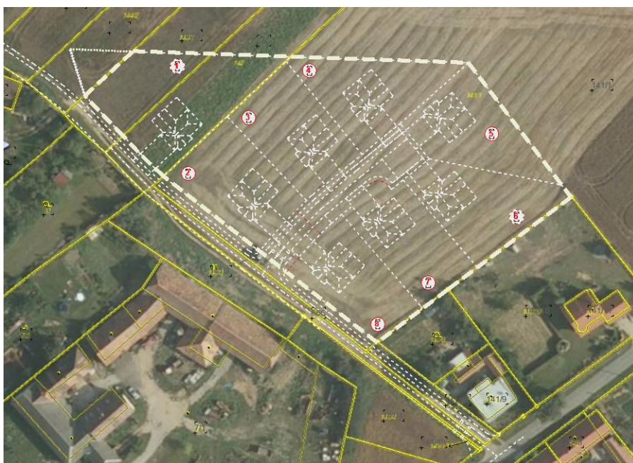
Mapa KN + ortofoto se zákresem návrhu