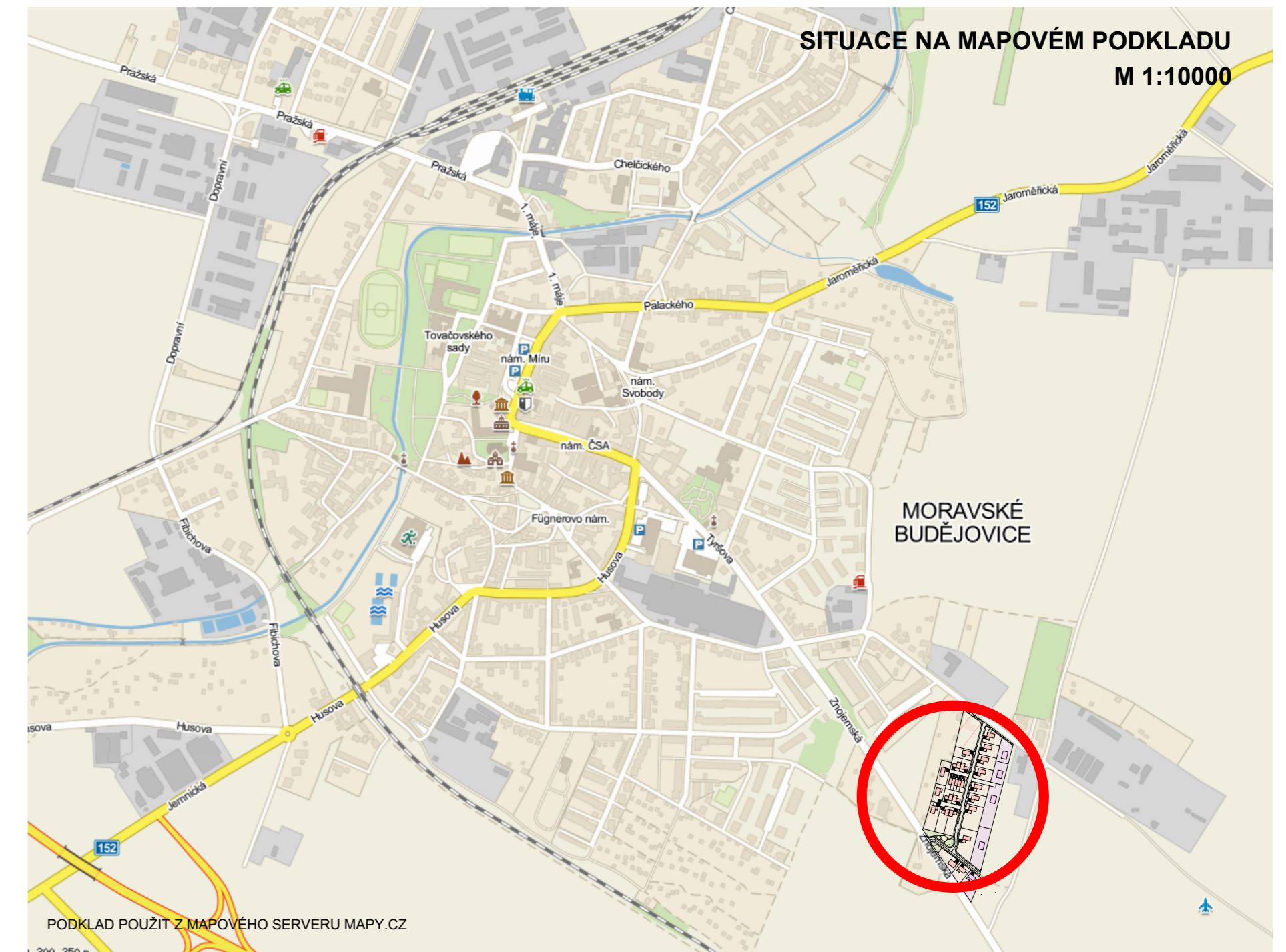
SITUACE NA MAPOVÉM PODKLADU M 1:10000