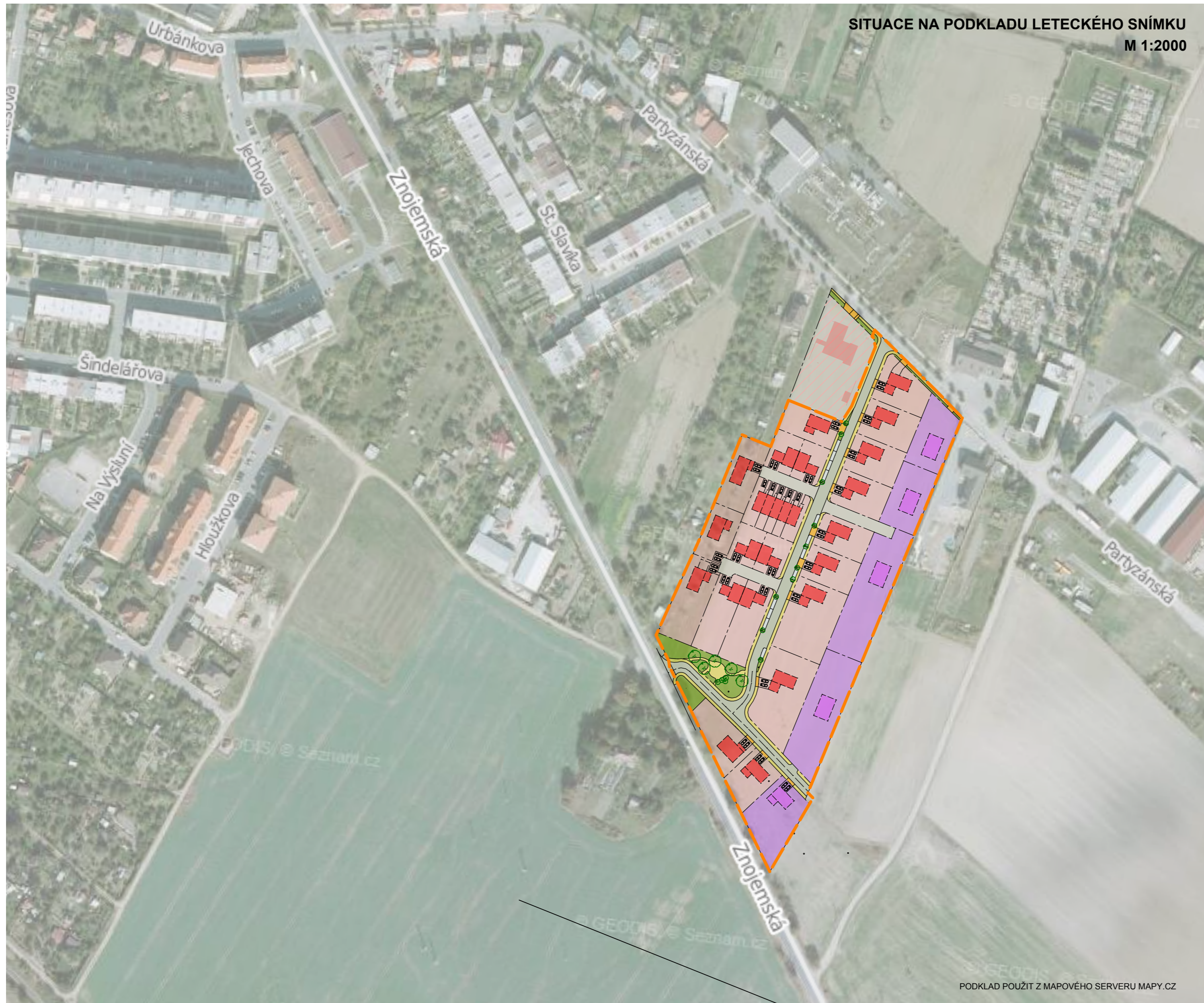
SITUACE NA PODKLADU LETECKÉHO SNÍMKU M 1:2000

PODKLAD POUŽIT Z MAPOVÉHO SERVERU MAPY.CZ